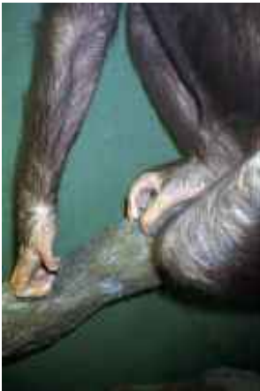
o.T., Leipzig 2007 C-Print 90 x 60 cm auf 100 x 70 cm