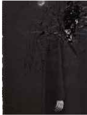
Mädchen, 2007 C-Print 100 x 70 cm