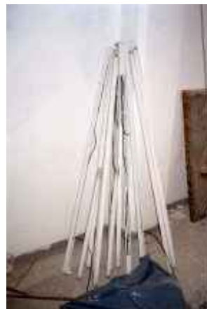
o.T., Leipzig 2007 C-Print 90 x 60 cm auf 100 x 70 cm