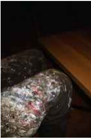
o.T., Leipzig 2006 C-Print 90 x 60 cm auf 100 x 70 cm