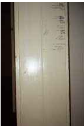
o.T., Leipzig 2004 C-Print 90 x 60 cm auf 100 x 70 cm