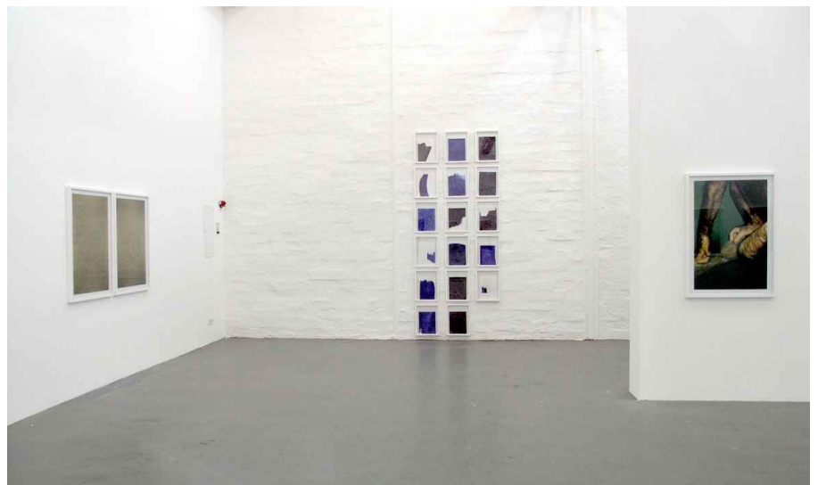
Ausstellungsansichten Installation Views