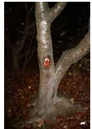
o.T., Leipzig 2006 C-Print 90 x 60 cm auf 100 x 70 cm