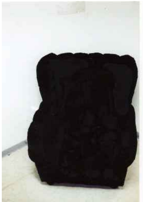
Schwarzer Sessel 2007 C-Print / 95 x 65 cm