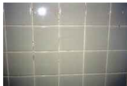
o.T., Köln-Bonn 2006 C-Print / 60 x 90 cm auf 70 x 100 cm