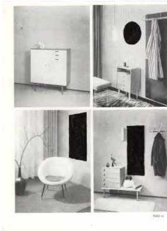
Schwarze Spiegel 2007 C-Print / 148 x 102 cm