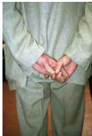
o.T., Berlin 2006 C-Print 90 x 60 cm auf 100 x 70 cm