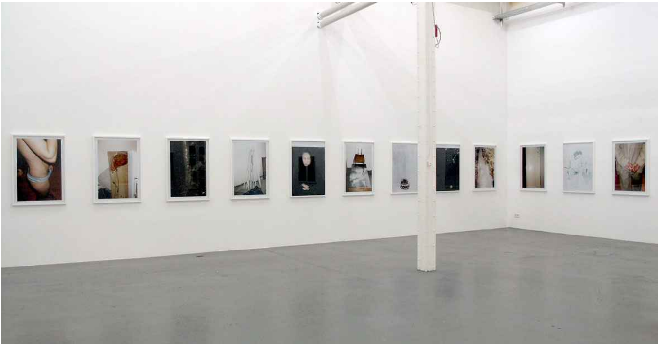
They're here 2007 Ausstellungsansicht Installation View