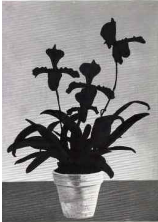
Schwarze Blume 2007 C-Print / 148 x 102 cm