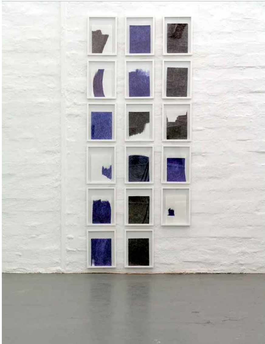
Alle Kugelschreiber meiner Eltern Ausstellungsansicht

Alle Kugelschreiber meiner Eltern in progress