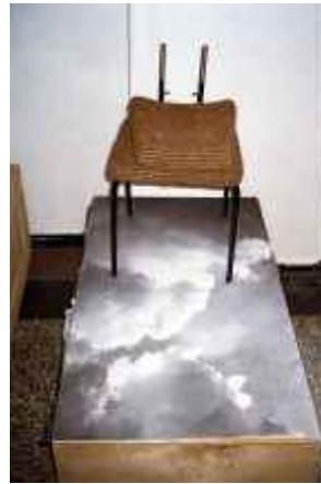
o.T., Leipzig 2007 C-Print 90 x 60 cm auf 100 x 70 cm