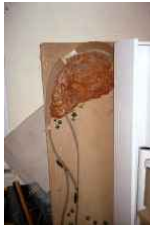
o.T., Eschefeld 2006 C-Print 90 x 60 cm auf 100 x 70 cm