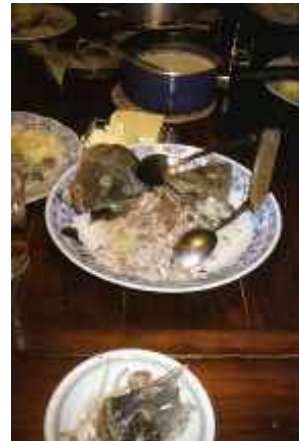
o.T., Eschefeld 2006 C-Print 90 x 60 cm auf 100 x 70 cm