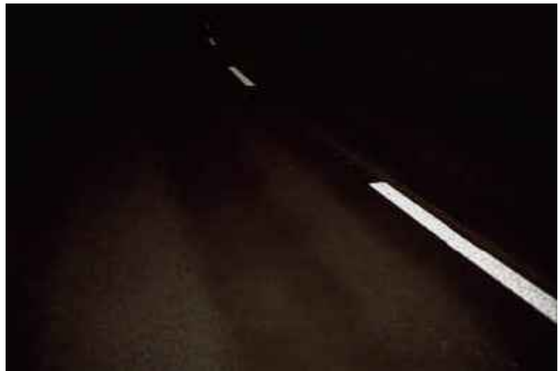
o.T., Baar 2007 C-Print / 111 x 169 cm