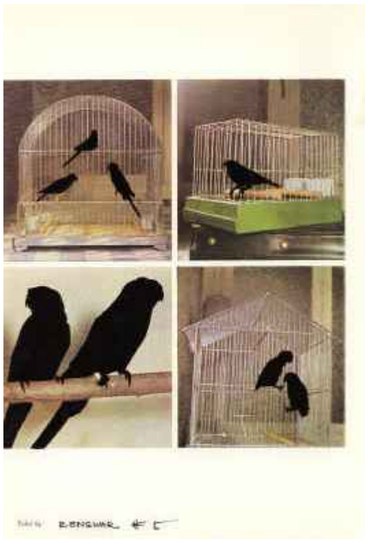
Schwarze Vögel 2007 C-Print / 102 x 72 cm