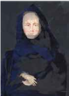
Lisa #2, 2007 C-Print 100 x 70 cm