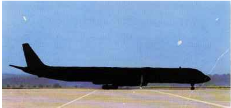
Schwarzer Flieger, 2007 C-Print / 31 x 65 cm