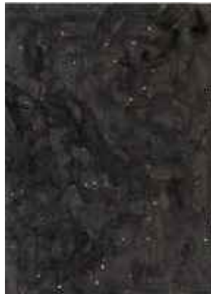
Gestirn, 2007 C-Print 100 x 70 cm