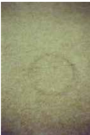
o.T., Leipzig 2006 C-Print 90 x 60 cm auf 100 x 70 cm