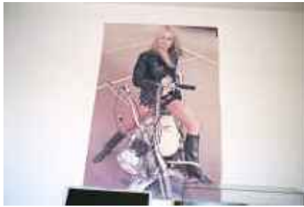
o.T., Frankfurt a. M. 2006 C-Print 60 x 90 cm auf 70 x 100 cm