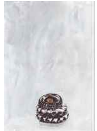
Reifen, 2007 C-Print 100 x 70 cm