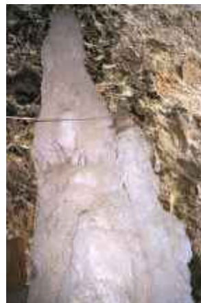
o.T., Kreta 2004 C-Print 90 x 60 cm auf 100 x 70 cm