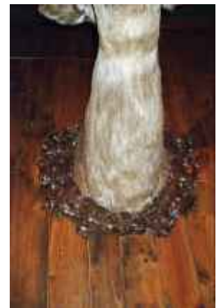
o.T., Leipzig 2007 C-Print 90 x 60 cm auf 100 x 70 cm