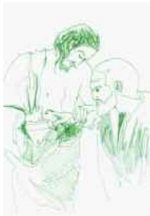
Nach Carravagio, 2007 C-Print 100 x 70 cm