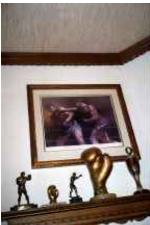
o.T., Köln 2006 C-Print 90 x 60 cm auf 100 x 70 cm