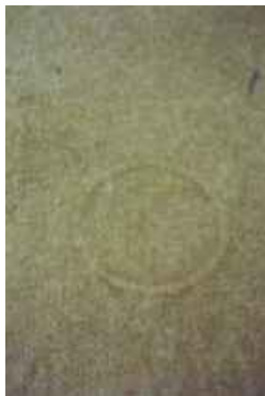
o.T., Leipzig 2006 C-Print 90 x 60 cm auf 100 x 70 cm