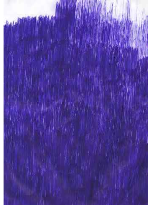
Alle Kugelschreiber meiner Eltern Kugelschreiber #7 (2. Blatt) 2007

Kugelschreiber #112007 Kugelschreiber auf Papier ~30 x 20 cm